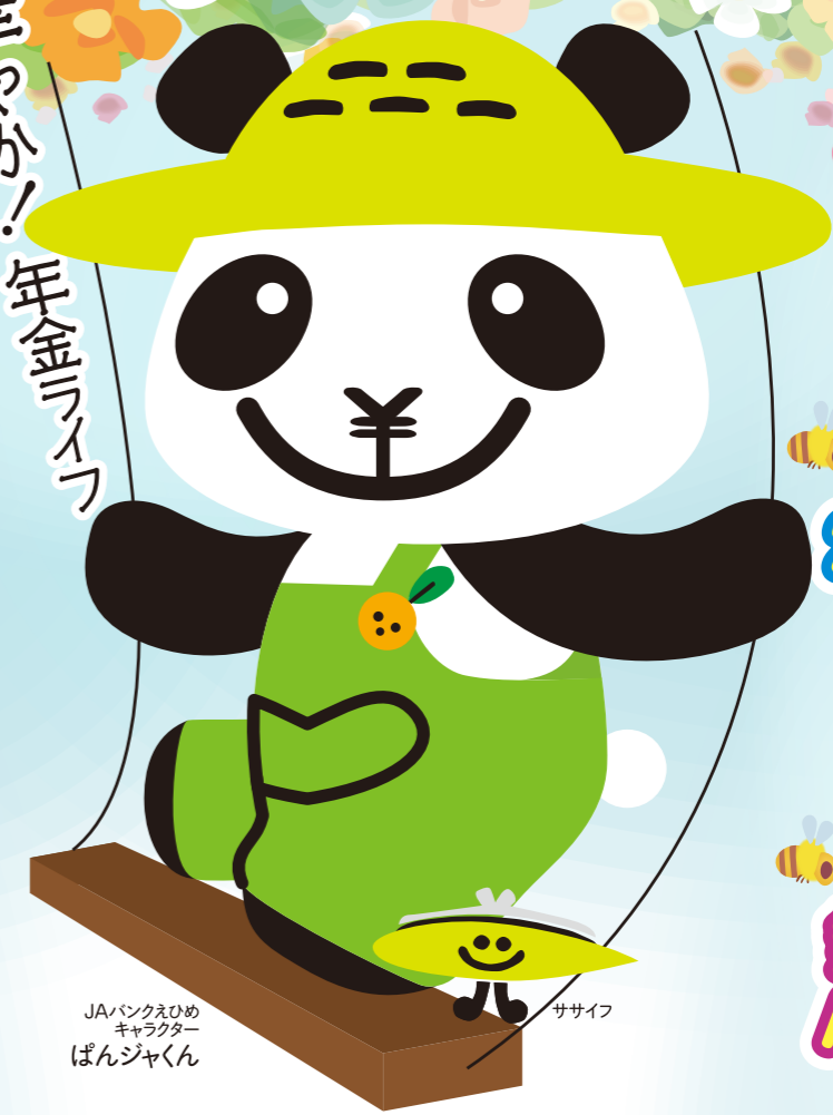
JAバンクえひめ キャラクター ばんじゃくん ササイズ